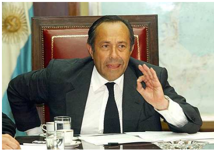
Adolfo Rodríguez Saá (23 – 30 de diciembre de 2001)