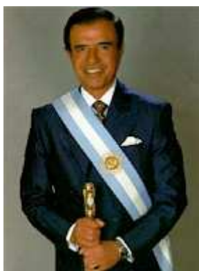
Carlos Saúl Menem (1989-1995 y 1995-1999)