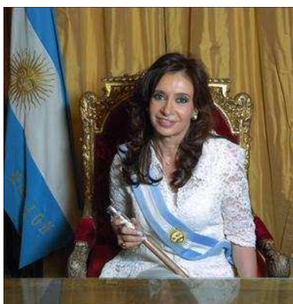
Cristina Fernández de Kirchner (2007-actualidad)