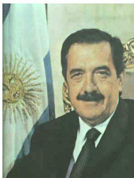
Raúl Alfonsín (1983-1989)