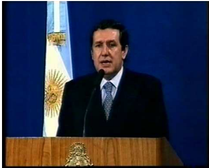
Ramón Puerta (20 – 23 de diciembre de 2001)