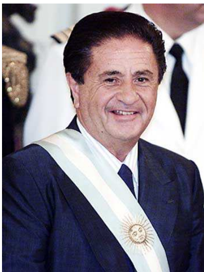
Eduardo Duhalde (2 de enero de 2002 – 25 de mayo de 2003)