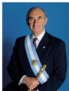
Fernando de la Rúa (1999-2001)