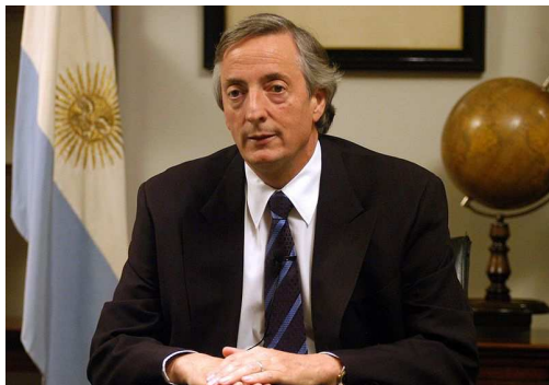
Néstor Kirchner (2003-2007)