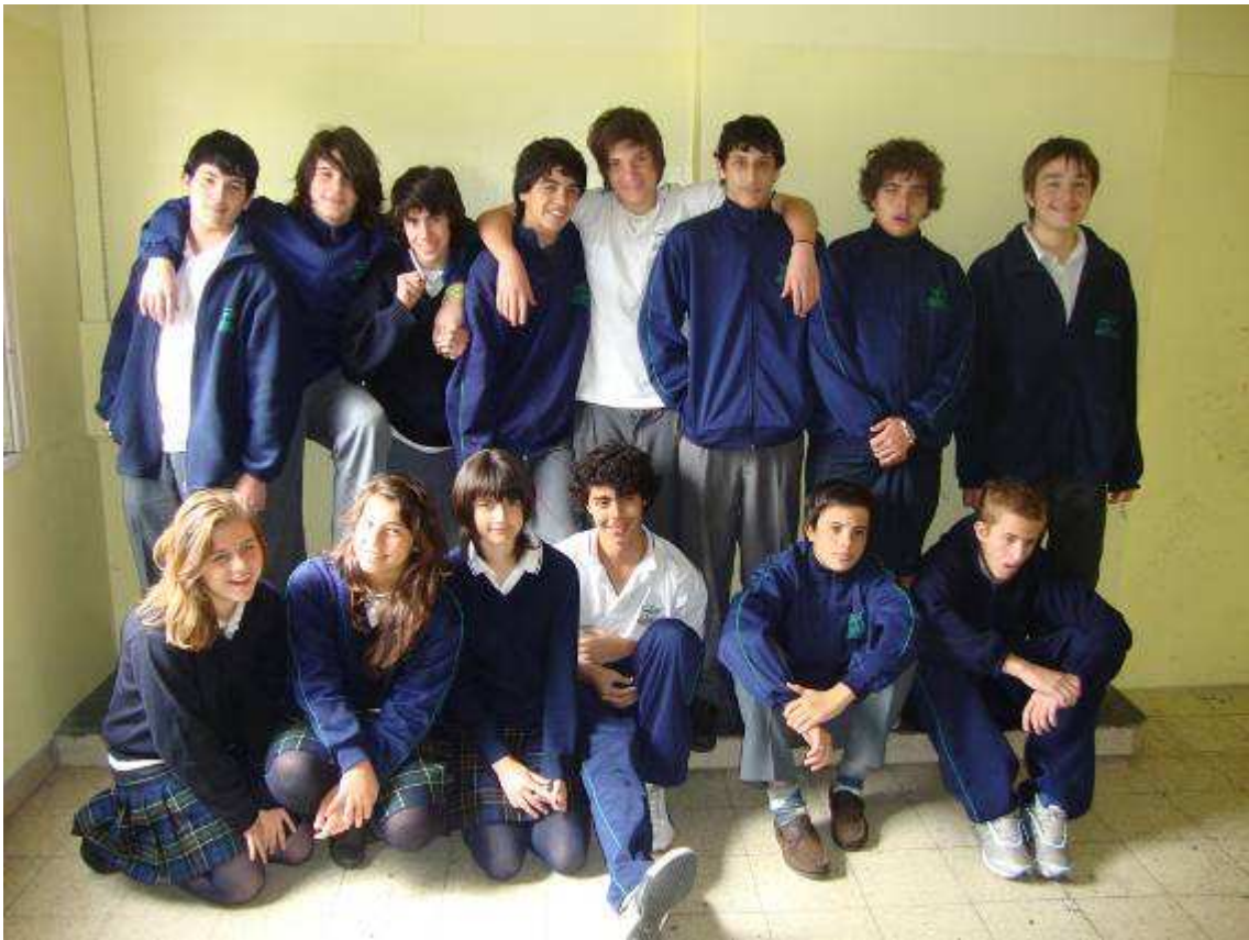
2º Año grupo ecohigienista